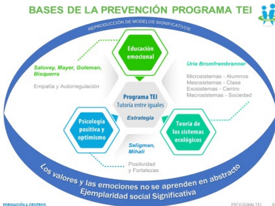
Ilustración. Esquema de Andrés G. Bellido 2002, 2014 y 2018