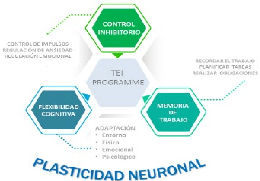
Ilustración: Esquema de Andrés G. Bellido 2002,2014 y 2018